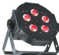
4 x Par Led Slim