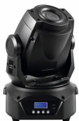
4 x Głowa Ruchoma Spot