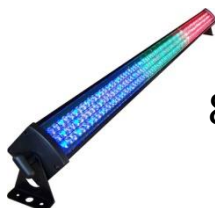
8 x Listwa Ledbar