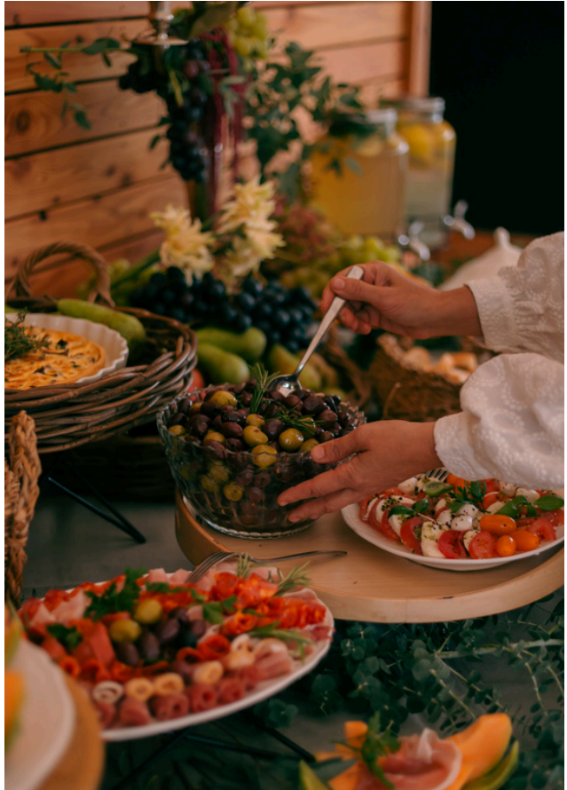
Winnica Wieliczka to coś więcej niż sala weselna. To 15ha przestrzeni z winnicą, lasem i zapierającym dech w piersiach widokiem.